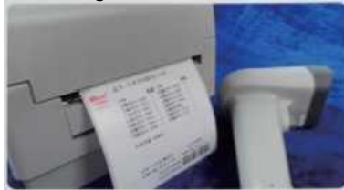
Cod de bare/imprimanta cod QR

Sistemul stabilește o bază de date pentru toate pungile sterilizate. Ne ajuta să distingem cu ușurință pungile cu textele tipărite și să urmărim pungile cu codul de bare sau codul QR pe etichetele indicatoare bine pregătite printr-o rețea internă. Astfel, suntem capabili să gestionăm bine pungile în mișcare de la un punct la altul în circulația spitalului din punct de vedere logistic