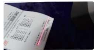
Urmărirea pungii prin scanarea codului de bare\