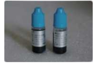
MD 150 Agent de testare sigilare 3mL / T