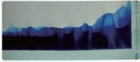
Cusăturile de etanșare sunt acceptabile

Testul standardizat de penetrare a colorantului pentru verificarea integrității sigiliului în conformitate cu ISO 11607-1 și ASTM F1929 se aplică în pungă sau rolă. Defectele, de exemplu canalele, sunt vizibile imediat în 20 de secunde.