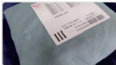
Etichetă indicator urmărire (straturi duble)