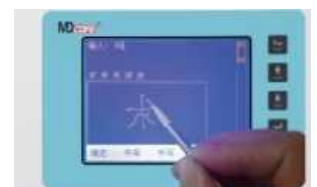
MD880N Input through Handwriting