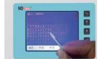
Intrare MD880N prin tastatura